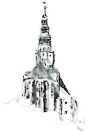
Kościół pw. Św. Stanisława i Św. Wacława Katedra Diecezji Świdnickiej

Proszę o wprowadzenie do porządku obrad sesji Rady Miejskiej w dniu 29.12.2020r. projektu uchwały w sprawie wyznaczenia obszaru i granic aglomeracji Świdnica.