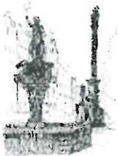
Rynek Fontanna z Neptunem